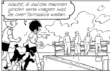
Fragment uit het Jommeke -album 'Het zevente zwaard'

Er moet getekend worden op wit papier. Dit kan, indien gewenst, worden bekomen in de