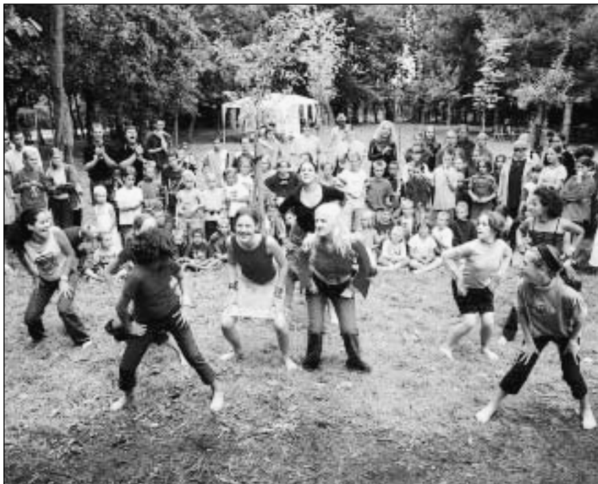
Deelnemers aan SpeGT-rock op vrijdag 23 augustus.

Meer dan 600 kinderen namen deel aan de werking. Dagelijks kwamen gemiddeld 160 kinderen over de vloer, met piekmomenten tot 220.