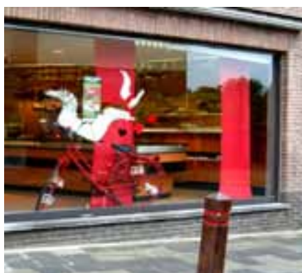
De bekroonde etalage.

Ter gelegenheid van de actie Met Belgerinkel naar de Winkel werd een etalagewedstrijd over heel Vlaanderen georganiseerd. Uit de meer dan 50 inzendingen koos de jury (UNIZO, CM en Bond Beter Leefmilieu) 1 winnaar met de mooiste etalage: bakkerij Meert uit Elversele (Dorpstraat 72i). Als bekroning werd haar etalageraam op woensdag 1 juni beschilderd met