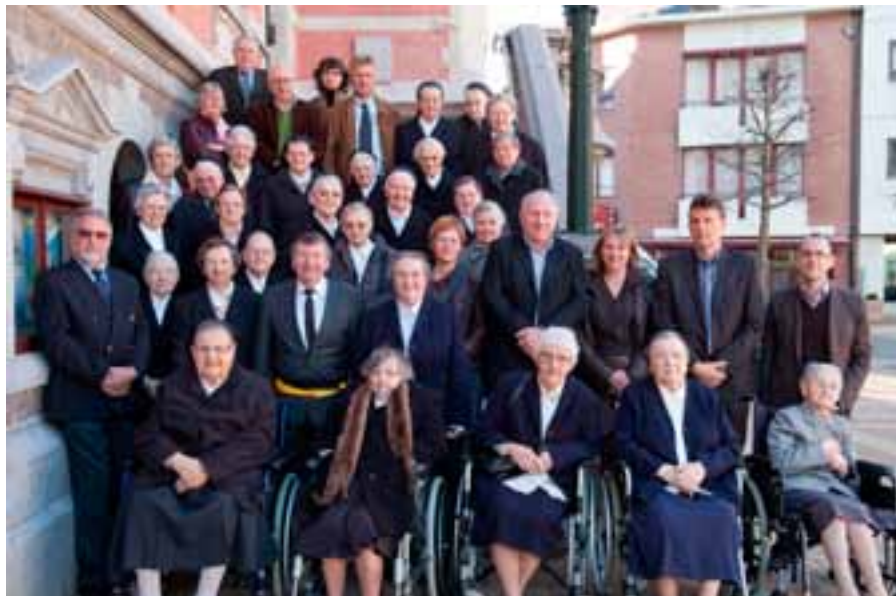
Staatsiefoto bij de ontvangst op het gemeentehuis.

Zondagochtend (9.30 u.) vond de eucharistieviering plaats in de Sint-Petruskerk. In Huize Vincent vond aansluitend de receptie plaats, 's namiddags ook de tentoonstelling. De expo werd door meerdere honderden belangstellenden bezocht.