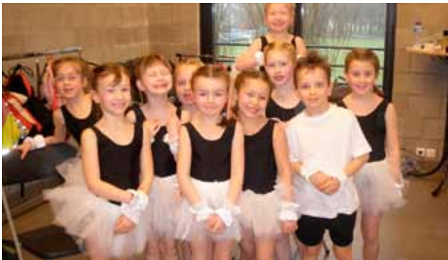
Leerlingen van de afdeling Dans, gestart in 2010-2011.

In de Muziekacademie in de Hoogkamerstraat kunnen geïnteresseerden terecht voor de afdelingen Muziek, Woord of Dans.